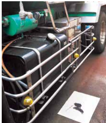
タンクローリー車等の停車時、充填時に。