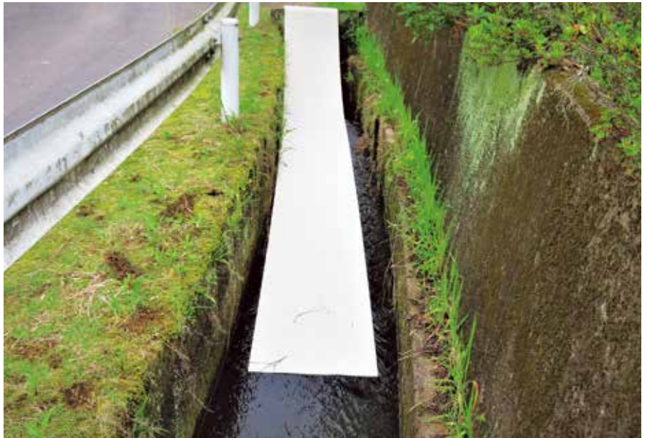
側溝での流出油に吸着対応