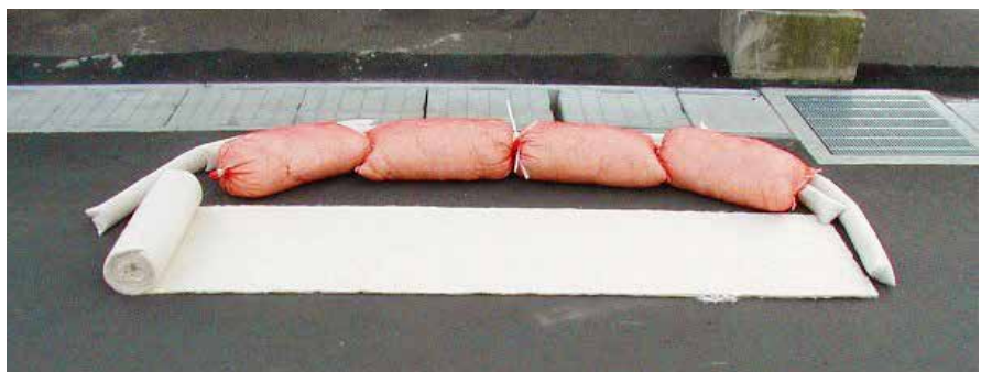
路面は水路前に置いて下さい。なるべく手前で吸着させます。