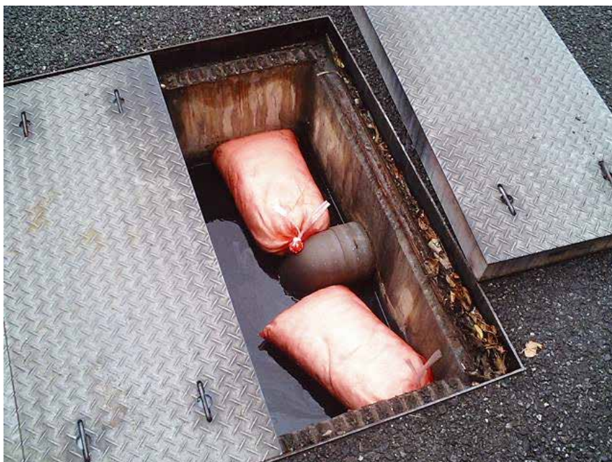
側溝、排水溝などでの浮上油処理に適しています。 ※回収用に紐やロープを接続する事をお勧めいたします。